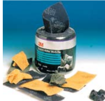
Листы Scotch-Brite™ Multi-Flex – супергибкость для обработки труднодоступных мест

Листы Scotch-Brite™ Pre-Cut и Multi-Flex фиолетовые для очистки и доводки металлических поверхностей, подготовки к окраске, обработки натурального дерева и МДФ, промежуточной шлифовки лаков и грунтов, матирования акрила и других синтетических материалов, растирки патины на массиве дерева