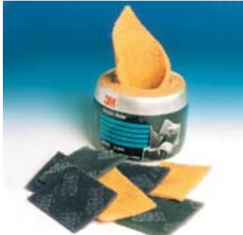
Листы Scotch-Brite™ Pre-Cut – исключительно высокая износостойкость